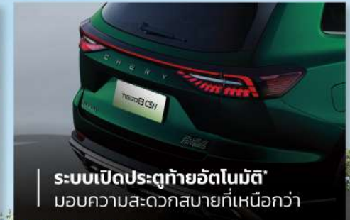
ระบบเปิดประตูท้ายอัตโนมัติ* มอบความสะดวกสบายที่เหนือกว่า