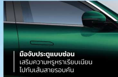
มือจับประตูแบบซ่อน เสริมความหรูหราเรียบเนียน ไปกับเส้นสายรอบคัน