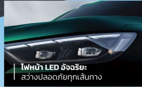
ไฟหน้า LED อัจฉริยะ: สว่างปลอดภัยทุกเส้นทาง