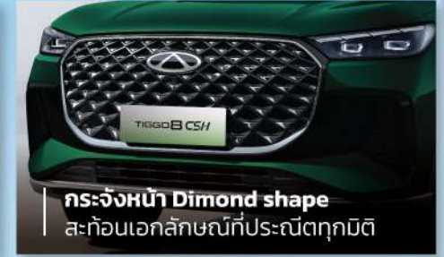
กระจังหน้า Diamond shape สะท้อนเอกลักษณ์ที่ประณีตทุกมิติ