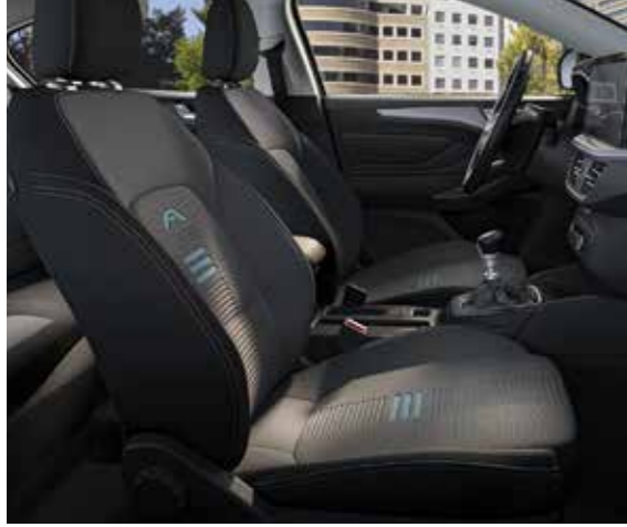
Nunatak Nordic Blue / Eton Siyah Active Grubu için Standart