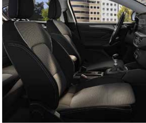
Ray Siyah / Eton Siyah Titanium Grubu için Standart