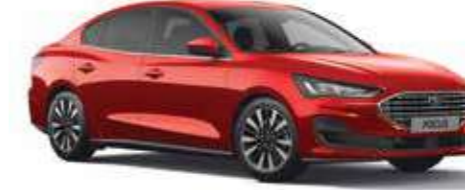
Fantastik Kırmızı Özel Metalik*