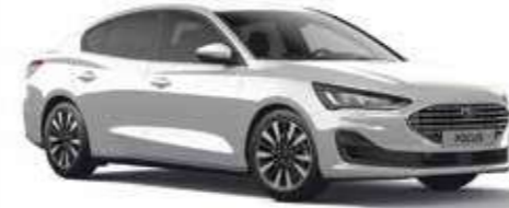
Aytozu Gri Metalik*

* Ekstra ücret karşılığında isteğe bağlı donanım.