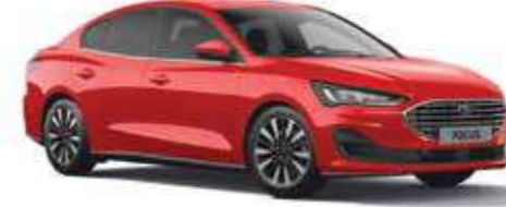
Spor Kırmızı Opak

Ford Focus, şık ve dayanıklı kaportasını çok aşamalı özel bir boyama sürecine borçludur. Balmumu enjekte edilmiş çelik gövde parçalarından koruyucu boyaya, yeni materyaller ve uygulama süreçleri Focus'unuzun benzersiz görünümünü uzun yıllar korumasını sağlar.