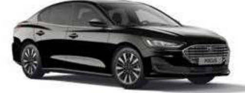
Akik Siyah Metalik*