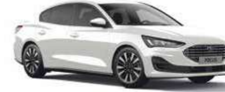
Buz Beyazı Opak