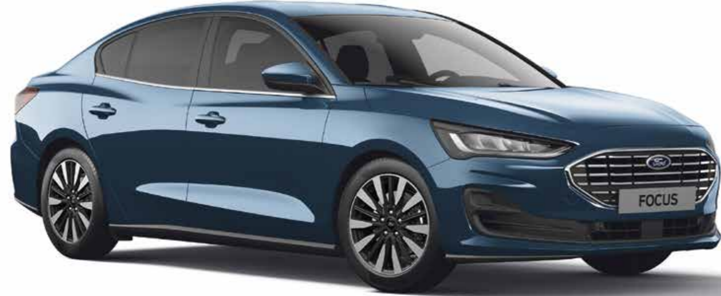
Pasifik Mavi Metalik*

İstedığınız rengi, opsiyonları ve aksesuarları seçin ve kendinize özel bir Focus yaratın.