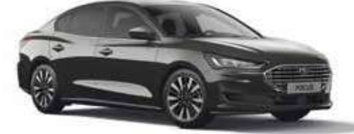
Manyetik Gri Özel Metalik*